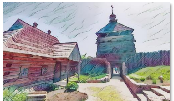
3 фотографії в малюнок